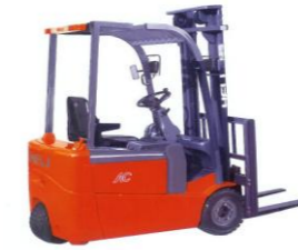
3 roues 1T5 à 2T, 48V