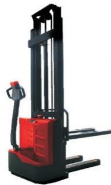
ES10-10ES Cap. 1T, 24V 105Ah h3 max : 3m30