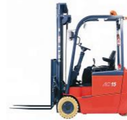
3 roues 1T5, 24V