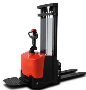
CDD12, CDD14, CDD16* Cap. 1T2, 1T4 & 1T6, 24V 280Ah h3 max : 5m00