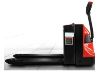
EPT20-20WA Cap. 2T, 24V 210Ah