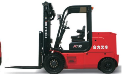
Cap. 4T, 4T5 et 5T