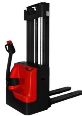
ES10 & ES12 Cap. 1T & 1T2, 24V 210Ah h3 max : 4m50