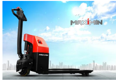
EPT20-15ET & EPT20-18ET Cap. 1T5 & 1T8, 24V 60Ah