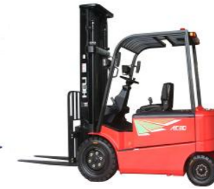
4 roues 1T5 à 2T5, 48V 3T et 3T5, 80V