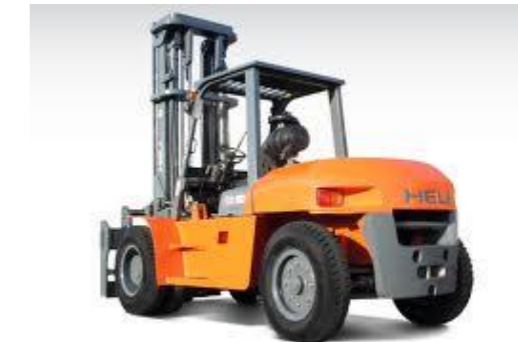
Capacité 5T à 7T, énergie GPL Capacité 5T à 10T, énergie diesel