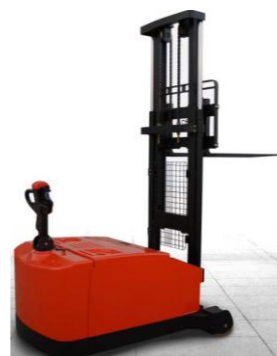
CDD12-970* Cap. 1t, 24V 270Ah h3 max : 3m50