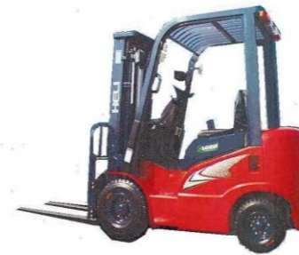
Capacité 1T5 à 3T5, énergie GPL ou Diesel