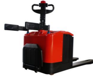
EPT20-25EEX Cap. 2T5, 24V 280Ah