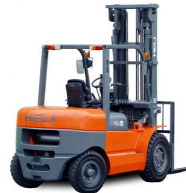
Capacité 4T à 5T, énergie GPL ou Diesel