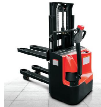
ES12-12WAI Cap. 1T2, 24V 210Ah h3 max : 4m50