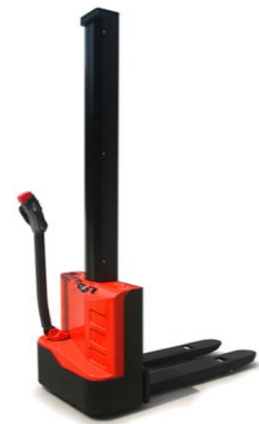
ES10-10MM Cap. 1T, 24V 80Ah h3 max : 1m95