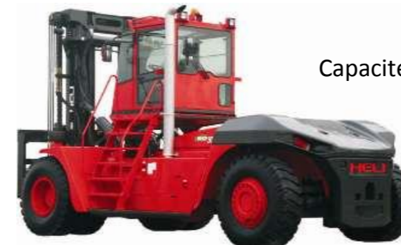
Capacité 12T à 46T Diesel